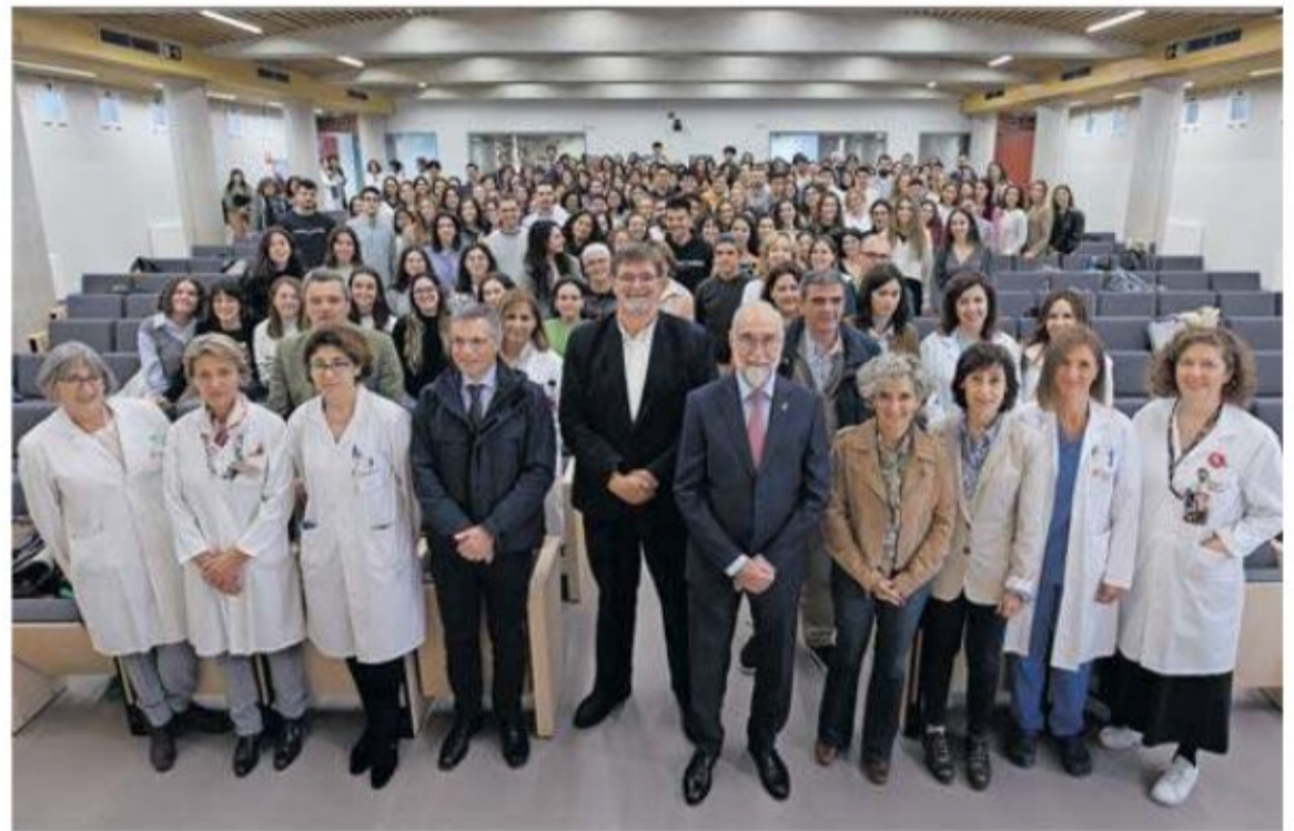
Las autoridades dieron ayer la bienvenida a los nuevos sanitarios que se van a formar en Navarra.

En cuanto a la lista de espera quirúrgica indicó que la actividad ha ido aumentando en los tres últimos años hasta 51.221 operaciones en 2023 (49.784 en 2018). Sin embargo, "cuando hay tapón en consulta la lista quirúrgica no crece más".