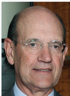
► MIGUEL CANALEJO Presidente de Redtel y de Nazca Capital