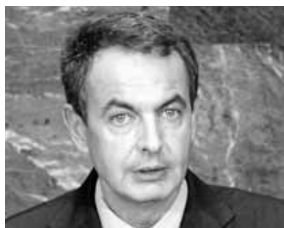
José Luis Rodríguez Zapatero.